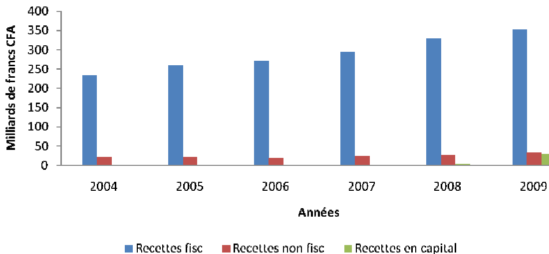
Graphique 1: Evolution des recettes propres à fin septembre de 2004 à 2009

Ces recettes ont été mobilisées à hauteur de 29,84 milliards de francs CFA à fin septembre 2009 sur prévision de 37,56 milliards de francs CFA, soit un taux de recouvrement de 79,4% contre 11,7% à la même période en 2008.